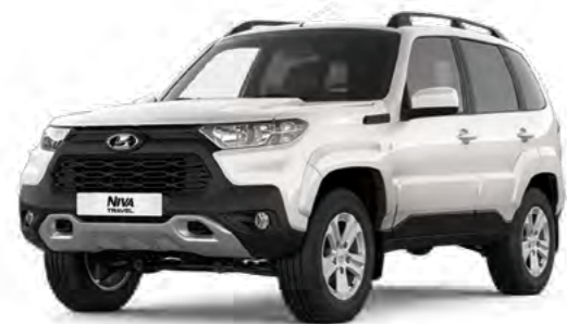
Ярко-белый «Айсберг» (204)