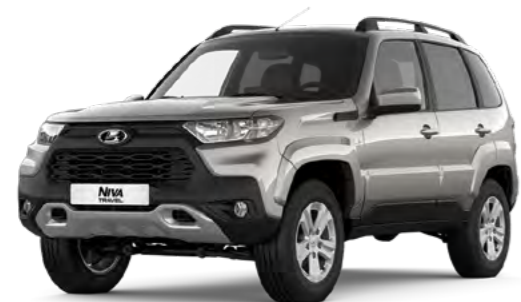
Серебристо-серый «Техно» (618)