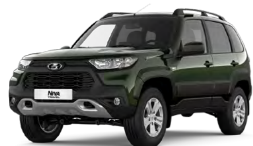
Темно-зеленый «Амазония» (324)