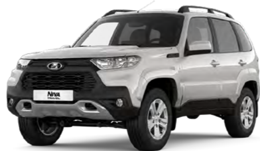
Светло-серебристый металл «Снежная королева» (690)