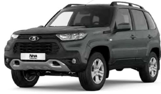
Серебристо-темно-серый «Борнео» (633)